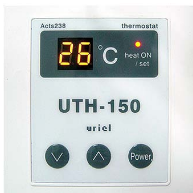
URIEL UTH-150 TERMOSTAT DE INTERIOR